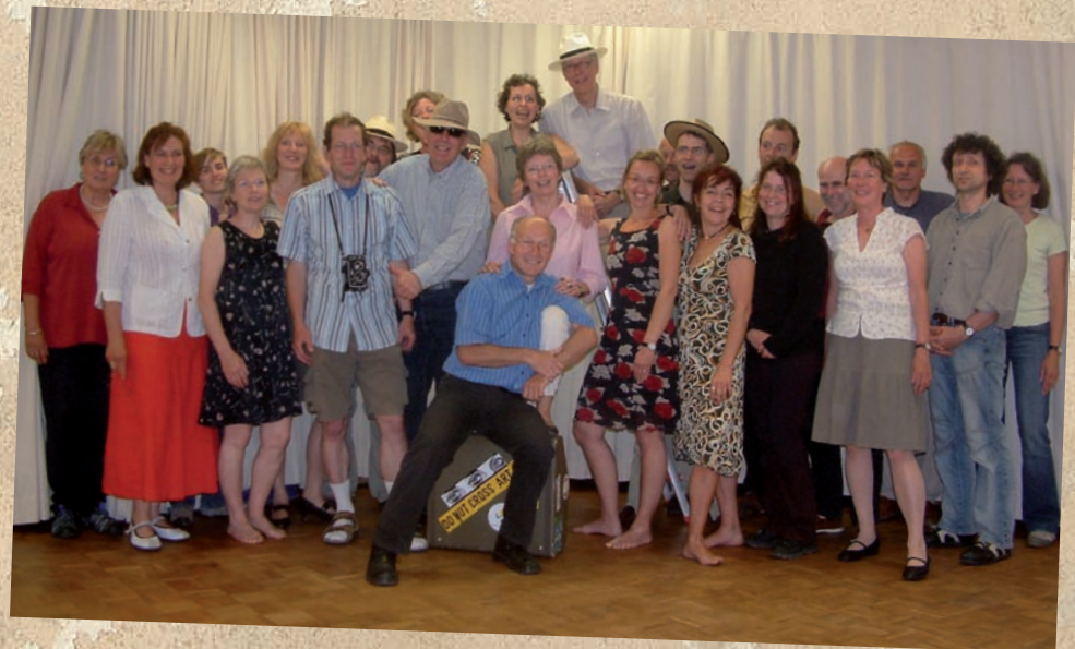
Woza-Chor 30 Jahre weltbewegt im Welthaus

Der Woza-Chor , einer der ältesten ‚freien‘ Chöre in Bielefeld, präsentiert in diesem Konzert Teile seines Programms, in denen zum Ausdruck kommt, dass Singen Kraft gibt im Wirken gegen Ungerechtigkeit und Unterdrückung in der Welt. Es geht nicht nur darum, Elend zu beschreiben. Singen und Tanzen geben Kraft für den Widerstand gegen Barbarei.